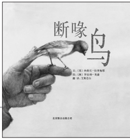
《断喙鸟》[美]纳桑尼·拉胥梅耶文[澳]罗伯特·英潘图艾斯苔尔译/北京联合出版公司2012年10月版/29.80元

“看罗伯特作品，总是让人感到平实亲切，优美中带着文雅；将个人的特质与理念，与绘画、文字作品充分结合，呈现在童书里并