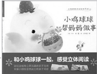
《小鸡球球帮妈妈做事》[日]入山智著 崔维燕译/湖北美术出版社2012年9月版/26.00元

这次会议期间还举行了全国第十届少数民族文学创作“骏马奖”颁奖典礼，并安排有专题讲座和分组讨论。交流探讨各地繁荣发展少数民族文学的成就、经验和举措。(郑 杨)