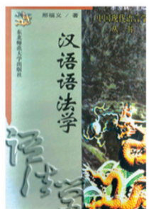
《汉语语法学》 第十一届中国图书奖 教育部人文社会科学一等奖