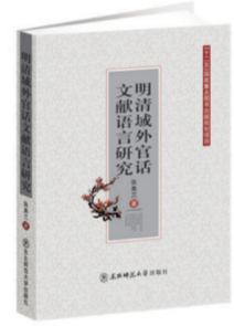
《明清域外官话语言文献研究》 第四届中华优秀出版物奖图书奖