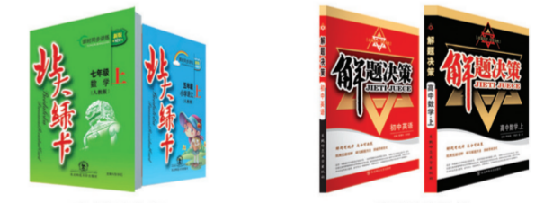
《北大绿卡丛书》 上市七年,创下11亿码洋的销售佳绩 《解题题典丛书》 2011年度全行业优秀畅销品种