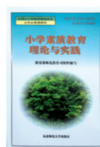
《小学素质教育理论与实践》 第十届全国优秀畅销图书奖