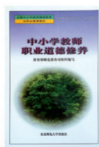
《中小学教师职业道德修养》 2000年全国优秀畅销书奖