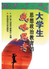
《大学生思想政治教育的战略思考》 “五个一工程”一本好书奖

30年来,东师社把自己的出版理想与蓬勃发展的社会需求紧密结合,重视梳理传统文化和典籍,及时反映知名学者的教学科研成果,出版了一批有社会效益的学术著作和高品位思想类图书。荣获了包括国家三大奖在内的各类奖项400多种,记录着作为出版人的贡献。《春秋左氏传旧注疏证补》终使得清代刘文淇残书完整,弥补了出版史上的百年遗憾;《辞源考订》为我国最重要的工具书的修订做出了贡献;《二十世纪现代汉语语法“八大家”》“标示着100年里该领域的研究水平和所达到的高度”;《明清域外官话语言文献研究》则是“首次将域外汉语研究同国内已有的本土汉语文献语言研究作对比研究,从一个全新的视角揭示了明清汉语的面貌,重现了汉语发展史辉煌的一页”。