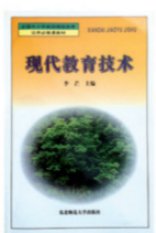
《现代教育技术》 第四届全国高校优秀畅销书奖 全国第九届教育图书畅销图书奖