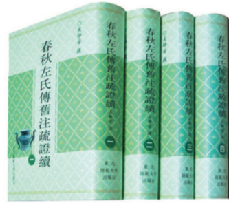
《春秋左氏传旧注疏证补》 首届中国出版政府奖优秀图书奖