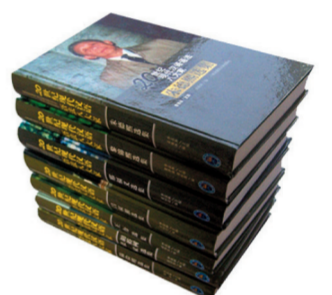
《20世纪汉语语法八大家》 第六届国家图书奖