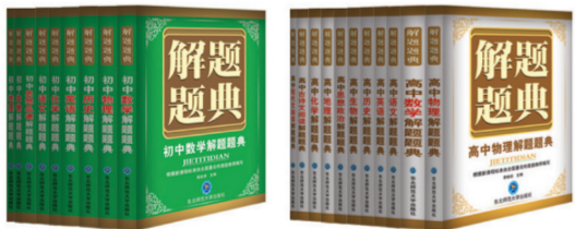
《解题题典丛书》 第五届全国高校出版社优秀图书 第十一届全国师范大学出版社讨论会畅销图书奖

东师社图书以教育出版为整体出版方向,以自主开发为主,构建了教师教育教材、高等教育教材、职业教育教材、学前教育教材、中小学教育类选题为主体的产品结构,走出了品牌化、特色化、专业化之路。其产品以“品牌、实用、权威”深受读者欢迎,畅销数年而不衰,在全行业、全国、高校、师范大学、专业类优秀畅销图书评定中荣获多种奖项。《解题题典丛书》是东师社教辅图书经典品牌,演绎了17年的畅销历史;《北大绿卡》上市7年,创下11亿码洋的销售佳绩。