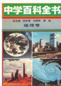
《中学百科全书》 第九届中国图书奖