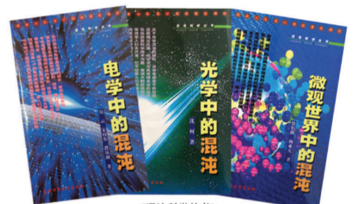
《混沌科学丛书》 第十二届中国图书奖