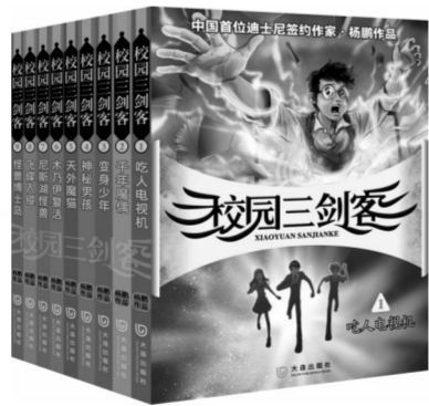
《校园三剑客》(共9册)杨鹏著/大连出版社2013年10月版16.00元(册)

值得一提的是,新世纪出版社的这套《小屁孩日记》中文版与原版共同出现,打破了出版常规。与以往一页中文一页英文或者一句翻译一句原文的形式不同,这次的版本更加强调原典的文学性价值。如果说翻译文字有可能导致读者对文本的理解产生偏差的话,那么这套丛书的设计就大大满足了读者品味原汁原味的作品的要求。今天的读者已经有能力进入更高层次的阅读,随着其阅读品位的提升,他们更渴望通过自己的方式来完成“非母语”阅读。在倡导多元化阅读的时代,这种颇具创新出版思路,具有启发意义,书本中的英语不只是作为提高成绩的工具,它也可以是进入另一种文化语境的钥匙,引导读者真正欣赏其审美价值。