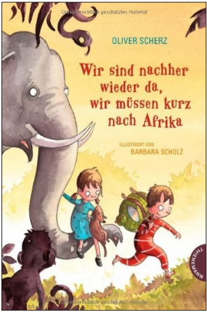
《我们会回来的,但我们要先出发去非洲》

第三本是《橡胶手环:橡皮泥制作时髦的装饰》(Rubberbands!: Hipper Schmuck aus coolen Gummis,海克·罗兰德、史蒂芬妮·托马斯著,Frech 5月10日