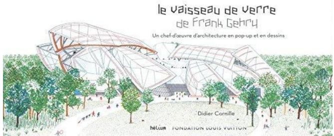
《弗兰克·热伊的玻璃船》

法国童书的内容很丰富,除了充满童趣的图画故事书之外,法国童书并不回避社会现实问题。比如,有的童书会讲到单亲家庭,通过叙述一个在单亲家庭中长大的主人公的故事,告诉孩子们应该怎么面对单亲家庭的生活,以及怎么对待身边生活在单亲家庭的朋友;有的童书会讲到种族歧视,用简单有趣的方式向孩子传达种族平等的观念;甚至还有有的童书会讲到死亡、我是谁、生命的意义等哲学话题。在许多法国童书上,标出的适合阅读的读者年龄都是0到99岁。有当地的童书从业者告诉我,在他们眼中,童书在表达上可以童言童语,但是这并不意味着内容就要简单、幼稚,因为童书真正目的在于引发孩子的思考。