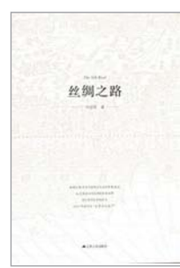
《丝绸之路》刘迎胜著/江苏人民出版社2014年9月版/42.00元

作者“以时间为经,以文明交流为纬”,从草原丝路的肇端说起。这条路上兴起过强盛的波斯帝国、马背上的匈奴帝国、击败