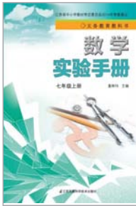
《数学实验手册》(七年级上册)董林伟主编/江苏科学技术出版社2014年7月版/6.02元

《数学实验手册》的内容编排紧跟苏科版《数学》教材的教学进度,力求呈现课程内容。实验的主题或取材于教学实际,或取材于学生生活,实验材料生动直观,注重揭示数学本质和体现数学思想方