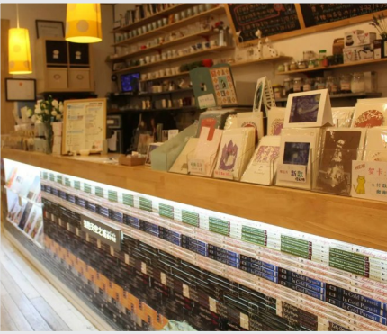
猫的天空之城概念书店