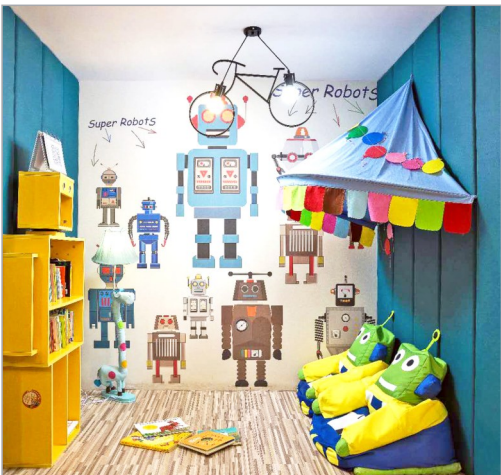
名称:安图睿国际教育 位置:长沙市雨花区迎新路御溪国际C栋一楼

安图睿的代先生告诉记者,暑期带孩子来安图睿,在各个主题室阅读绘本享受快乐,68元可以无时限任性选择一次,但如果你办会员卡充值2980元,就可以在一年内无限次地阅读和借阅图书,并可到绘本影院里免费观影,去绘本剧场听老师讲绘本里的故事。