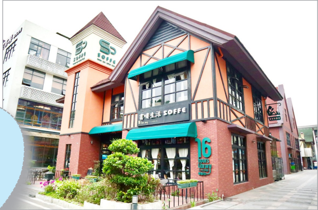
名称:书啡生活 位置:深圳市龙华区大浪街道大浪商业中心

走近书啡,映入眼帘的是一栋具有欧洲风情的尖顶钟塔阁楼,上下两层的复式结构,砖红色的复古外墙配上阁楼周围的绿色植被,显得有韵味极了。