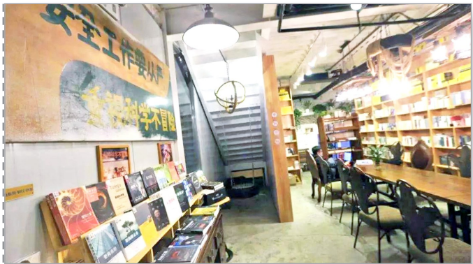
名称:全民畅读特钢店 位置:北京市石景山区杨庄大街69号筑福国际西厂

“一个具有魔法的地方,到了这里有种不想离开的感觉,第一次光临,就足足坐了5个小时。给自己定个小目标:2018年要在这里看完50本书。”这是一位网友体验了北京石景山全民畅读后的网上留言。日前,记者怀着渴望的心情到全民畅读体验了一番。