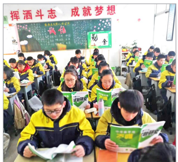
学生使用万唯中考图书

16年来,万唯深耕中考教学服务领域,遵循“专业的人做专业的事”的理念,组建研发团队。16年创新引领,持续推动中考教学服务提质升级,“中考备考用万唯”的全国共识日益深入。现在,更多名校总复习是从《试题研究》开始。