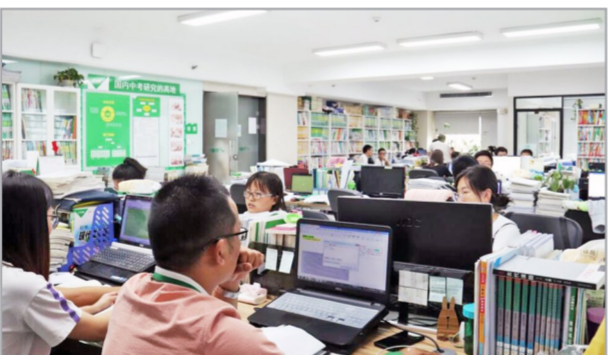
万唯中考研究院办公场景一角

走进万唯中考研究院,如同走进一座图书馆:各版《课程标准》、历年“中考说明”、各版本教材、详细批注的各省区16年中考试题、《史记》《古代志怪小说》《西京杂记》等二十四史、类书、笔记,各类报刊、杂志和现代当代作家文集……一排排书架,被塞得满满当当。