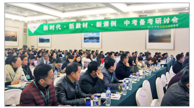
万唯中考公益备考会

为帮助老师把握中考方向,提高教学、备考效率,从2017年7月开始,万唯特邀教育改革先行省市中考专家,围绕考改动态、统编教材、核心素养等内容,在河北、河南、安徽、陕西、山西、云南、江西等地相继举办90余场中考公益备考会,累计服务教师25000余人次,场场反响强烈。