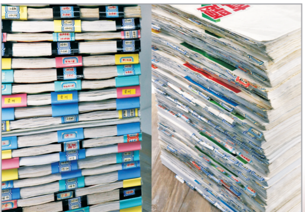
万唯中考研究院一位语文研究员分析的历年各省区1734套试题

这些只是万唯中考研究院工作内容的一部分,做好研究、练好内功,是做好中考教学服务的基础。