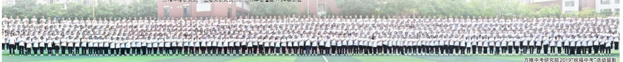
万唯中考研究院2019“祝福中考”活动留影

很多到访万唯的专家、老师都会惊叹,万唯竟然有600多人的中考研究院,此外还有超过3000人的兼职研发人员!据了解,这是全国首家也是目前规模最大的