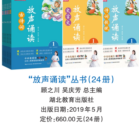
“放声诵读”丛书(24册) 顾之川 吴庆芳 总主编 湖北教育出版社 出版日期:2019年5月 定价:660.00元(24册)