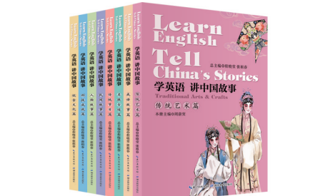
“学英语 讲中国故事”丛书(全8册) 程晓堂 张祖春 总主编 湖北教育出版社 出版日期:2019年3月 定价:236.00元