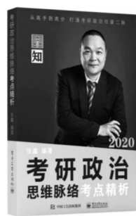
《考研政治思维脉络考点精析》张鑫著 电子工业出版社 2019年06月版/88.00元

钱穆先生曾说过:不读中国史,不懂中国人。而作为中国人,不懂中国史,就是不懂自己。所以推荐这盘热气腾腾的“历史饺子”给大家,就是因为它是我们每一位中国人必不可少之精神的营养、精神的食粮。