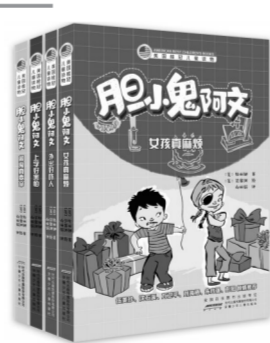
「美国桂冠儿童读物·胆小鬼阿文」系列 陆丽娜著,范黎渊绘;向丽娟译 安徽少年儿童出版社 2019年06月版/88.00元

阿文便是在这样爆笑又温柔的世界里成长着。这也就是孩子的世界,每天都充满惊喜和惊吓,而大人们所需要做的,就只是耐心地、温柔地等待他们成长,就像小王子守护自己的玫瑰花儿一样。