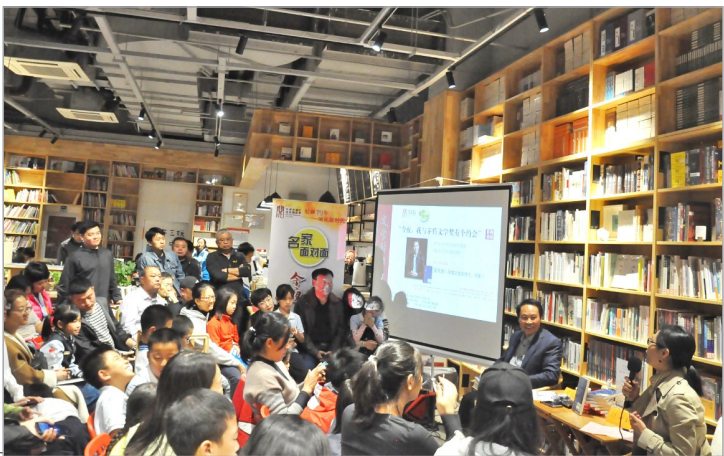
名家面对面茅奖得主周大新活动现场

一本好书,能让我们发现思想的美妙,在想象的世界流连忘返;也能让我们忘却现实中的烦恼,与艺术世界中那些有趣的灵魂相遇。我们愿以这份书单,为爱书人导读。来,让我们一起读书吧!(链接:2019年度第叁季度影响力图书详见本报2019年10月22日第13~16版)