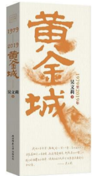
《黄金城》吴文莉著 陕西师范大学出版社2021年1月版 59.80元

“百年百部红旗谱”大型系列丛书中的入选作品体现党史与新中国史、改革开放史、社会主义发展史的统一，涵盖从中国共产党创立到土地革命战争、抗日战争、解放战争、抗美援朝、新中国建设、改革开放、新时代等每个重要历史时期。中国言实出版社社长王昕朋介绍，该社2019年便已开始着手组织整合出版资源，策划这一大型系列丛书，2020年1月11日便邀请阎明、仲星祥、谢勉、梁鸿、张颐武、胡平、何向阳、王干、王山、贺绍俊、傅逸尘等20多位专家学者召开选题策划会，开始组稿。他说：“建党一百年，一百位著述者，一百部书，这是一首浩浩荡荡的长歌，是跨越时代的几代人的合唱。”据悉，“百年百部红旗谱”系列丛书将于近期分批出版，2021年7月1日前全部完成，向中国共产党成立100周年献礼。(李昌鹏)