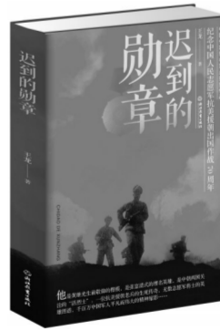
《迟到的勋章》王龙著 浙江教育出版社 2020年12月版/89.00元

《迟到的勋章》更多地把笔触伸向柴云振个人历史深处,以及隐性埋名33年的艰辛生活,梳理出一条英雄坚守初心、不忘来路的故事主线。这些故事至今鲜为人知,读来感人至深。柴云振成为英雄之前的人生,艰难坎坷,颇有传奇性。出身贫苦的他,15岁被抓壮丁当了国民党兵,后向人民解放军