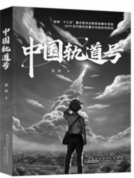
《中国轨道号》吴岩著 安徽少年儿童出版社 2020年12月版/35.00元

伟大事业始于伟大梦想。“嫦娥五号”圆满完成月球探测任务,带着月壤标本返回地面;“天问一号”火星探测器在地球1亿公里外的轨道上继续朝火星飞行;新一代中型运载火箭“长征八号”在中国文昌航天发射场成功试飞……在时间长河里,一代代中国人为了保卫祖国的蓝天,为了早日实现建设航天强国的伟大梦想而奋斗拼搏,永不止步。