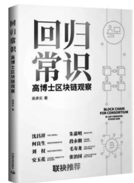
《回归常识》:高博士区块链观察 高承实著 中国发展出版社 2020年11月版/48.00元

区块链的发展,《回归常识》认为目前主要是两个大方向:一个是产业化的方向,也是作者思考的主要内容和方向;另一个是数字货币及其应用,包括skating以及defi,这个方向的内容不多。但两者都会造成对现有秩序的严重冲击。从理论上来说,不用区块链也能达到相关的作用,但是用区块链能够让不信任的主体通过数据的高度冗余和不可篡改建立起相应的信任关系,但这种数据公开透明和信任关系一定是相互的,而不是单方面的。需强力推动期待区块链技术在慈善行业的应用,公有链,去中心化,不可篡改,人人可查证,可惜区块链改变不了人性。