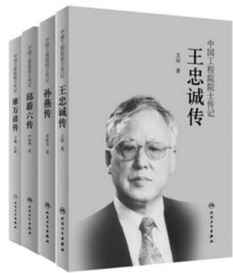
“中国工程院院士传记”严伟明等著/人民卫生出版社2018年~2020年陆续出版/88.00元~170.00元(册)

推荐理由:伴随着中国共产党的发展壮大,一批历史悠久、文化深厚、深得民心的医院为守护人民健康做出了历史性的工作。“中国现代医院史话”系列丛书展现了中国医疗卫生事业在漫长曲折的历史中如何从星星之火逐步形成燎原之势,可以看到医疗卫生工作者如何在波澜壮阔的史诗中担当道义。一本湘雅史话,对湘雅的历史进行了全景式回顾,也对湘雅的未来发展蓝图作了鸟瞰式的展望,将医院发展与文化建设的历史与现代、传统与创新、科学与人文充分展现。