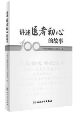
《讲述医者初心的故事》中国卫生健康思想政治工作促进会编/人民卫生出版社2019年8月版/87.00元

推荐理由:该套丛书由中国工程院组织编写,已被列入“十二五”和“十三五”国家重点图书出版规划,人民卫生出版社承担中国工程院医药卫生学部院士的传记出版工作。丛书用简单平实的语言记录了院士们为祖国和人民作出的贡献,身处逆境依然一心向党,面对困难从不言弃。全面展现了我国科学发展、技术进步的艰难历程和辉煌业绩,必将对社会大众树立科学思想、弘扬科学精神、提高科学素养产生重要影响,激励广大科技工作者为实现中华民族伟大复兴的中国梦而奋斗。