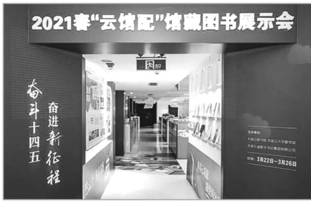
2021浙江省春季“云馆配”图书展示会3月22日开幕