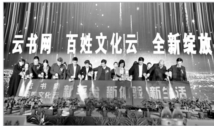
中原出版传媒集团云书网、百姓文化云2.0版上线