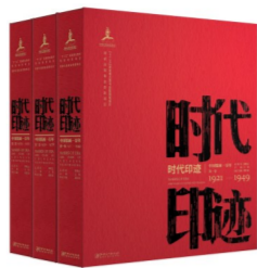
《时代印迹——中国版画一百年》 总顾问:邵维正 主编:王炜 执行主编:郑作良 出版时间:2021年3月

卢沟桥事变爆发后,全民族掀起抗战的热潮。这个时期的版画不仅数量多,而且爱国情结深。版画家们挺身而出,以画笔为刀枪,揭露日本侵略者的残暴,唤起同