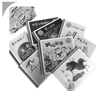
百年百部中国儿童图画书经典书系(壹)于大武、戴敦邦等著/长江少年儿童出版社2019年11月版/352.00元

回望70年中国童书发展历程,重新审视那些消逝在国民记忆中的图画书,研究者会发现一个颠覆认知的事实——我国的原创图画书历史并不是从新千年前后开始纪元的,而完全可以追溯到民国时期。更重要的是,新中国成立之后的1950年代和1980年代也都涌现过大量经典,只是由于几十年来出版社的重组和新老出版物的更替,使得很多过往的优秀作品渐成绝版,更造成我们对众多建国以来的经典图画书缺少准确的认知和定位。这里以《神笔马良》和《萝卜回来了》为例,说说经典图画书的传播和再版。