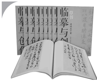
“临摹与创作”丛书(共10册)李宏伟、李斯特著/荣宝斋出版社2020年3月版/380.00元

“临摹与创作”丛书近日由荣宝斋出版社出版。捧读该套丛书,令人神清气爽,如饮甘醴,回味无穷。顾名思义,该书的意义在于打通书法临摹与创作的鸿沟,给书法创作者提供一座通向自由创作的桥梁。集古字是创作中的重要一环,史书记载米芾:“壮岁未能立家,人谓吾书为集古字,盖取诸长处,总而成之既老,始自成家人见之,不知以何为祖也”。可见米芾就经历了一段集字创作的阶段,最后卓然成家。该丛书遵循书法的创作规律,以集字的方式面世,共10册,八开本,印刷精美,设计精良,是不可多得的图书,它有两个特点。