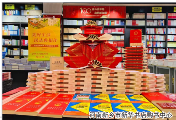
河南新乡市新华书店购书中心

和上期一样,这次我们依然挑选了七大类(主题出版、文学、人文社科、教育艺术、生活科普、财经和童书)135种新书。这份书单自然难以囊括所有的好书,但我们希望至少能给炎炎夏日中的您奉上一份清凉的阅读指南。当然也欢迎您通过中国出版传媒商报和我们阅读周刊“好书探”公众号、视频号与我们互动,留下您的真知灼见。您的鞭策,将是我们前行的动力。