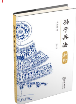
《孙子兵法新论》吴如嵩著 商务印书馆 2021年8月版 65.00元

吴如嵩在学术界德高望重,堪称“道高、业精、德馨”的楷模,如今他年逾八旬,依然笔耕不辍。他从事军事科学研究40余年,在军事战略、军事历史等领域,尤其是古典兵学等方面有很深的研究,著有《孙子兵法浅说》《孙子兵法新说》《孙子兵法十五讲》《徜徉兵学长河》《制胜智慧》《洗尽甲兵》等20余部专著,对《孙子兵法》研究作出了重大贡献。吴如嵩的著作有一个共同特点:文字淡雅而质朴,内容博大精深,思想宏远深邃,有珠玉蕴藏其中。正如他本人一样,温和而仁厚,谦逊而低调,风雅而睿智。他生活简朴,淡泊名利,将毕生的热情和心血都放在学术研究和人才培养上,是值得我们尊敬和学习的人。值此《孙子兵法新论》再版之际,特别推荐该书。