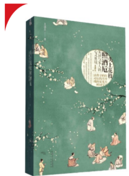
《头上花枝照酒厄:宋词与宋人的心灵胜境》王倩著 陕西人民出版社 2021年7月版 78.00元

宋词在宋代接近于流行音乐。对很多词作者来说,写点“小歌词”只是他们壮阔一生中的一点闲情。然而作者正是抓住了这“闲文字”中未设防的真挚,写出了在这个风流世代里,宏大叙事与个人叙事的争斗交缠,写出了词人们各自鲜明的性情,剥丝抽茧地展示出他们用“小歌词”漫不经心表露出来的幽深心事。像遨游历史的深海,打开了古典主义的蚌壳,作者给读者观赏美丽的珍珠,也让读者了解到,这些活生生的珍珠,是怎样用柔软的血肉包容了命运侵入的砂石,日升月落,化作莹莹珠光。