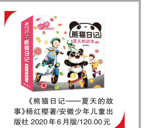
《熊猫日记——夏天的故事》杨红樱著/安徽少年儿童出版社 2020年6月版/120.00元

全书插图借鉴中国传统水墨画和工笔画的画风:中国传统水墨画色彩柔美,意境深远,培养高尚的审美情趣;中国传统工笔画细腻传神,写实精美,通过呈现准确的事物,让孩子达到认知的目的。“熊猫日记”用一个个有趣立体的故事展现了丰富的知识,也传达出一种情怀和对中华优秀传统文化的热爱,实现了作家让孩子们“通过这套书开始看世界”的创作初衷。《夏天的故事》是该系列的第二辑,散发着浓浓的中国味道。