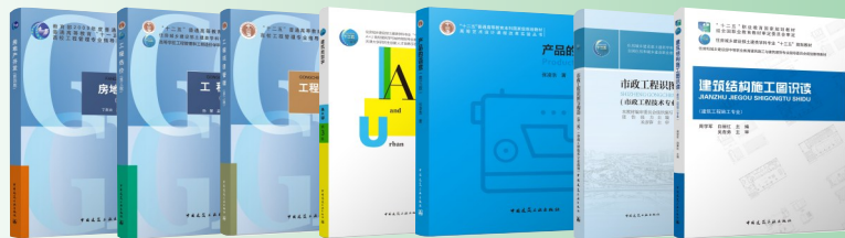
首届全国教材建设奖——中国建筑工业出版社获奖图书信息