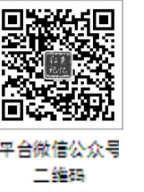
平台微信公众号二维码

弘扬伟大长征精神,走好今天的长征路,是新时代面临的重大课题。贵州是红军长征途经的重要省份,始终致力于长征文物和文化资源的保护利用及长征精神的传承弘扬。本期“文化带出版工程”栏目特别刊发贵州出版集团“红色记忆·贵州长征国家公园公共文化服务平台”建设情况及贵州人民出版社相关主题图书出版情况。