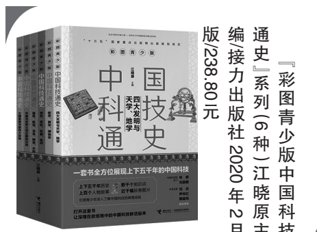
「彩图青少版中国科技通史」系列(6种)江晓原主编 接力出版社2020年2月 版238.80元

正如《南泥湾》中所唱的,把荒凉贫瘠的南泥湾建成了“处处是庄稼,遍地是牛羊”的陕北好江南。饱含激情的歌声深刻反映了“军爱民,民拥军”的鱼水之情,也体现出中国共产党全心全意为人民服务、为民族解放而英勇奋斗的崇高精神。