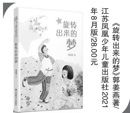
江苏凤凰少年儿童出版社2021年8月版28.00元

值得注意的是,该书附有作者工笔墨彩手绘的南极海鸟谱、南极海兽谱(含拉丁学名、中文名、分布情况、何处观赏等),为国内首部完整呈现南极海鸟、海兽的出版物。此外,第五届中国出版政府奖装帧设计奖、“中国最美的书”获得者尹琳琳用新型材料、印装工艺呈现南极自然之美。(童尚)