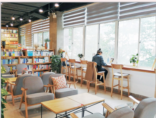
倍阅·湖北经济学院店