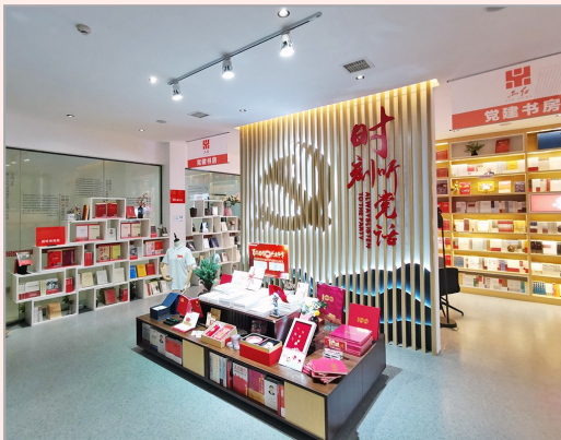
湖北省新华书店集团总部“品红”党建书房

湖北新华在各地党建书房成功举办了多 场党建活动、基层党员学习交流,真正将 全民阅读与党史 学习教育相结合, 配合党建活动、党 史教育、知识服 务、展览展示等内 容,切实做到服务 于群众,为广大读 者办实事。接下 来,湖北新华还将 不断完善党建书 房服务功能,充分 发挥“党建书房” 党建学习、阅读分 享、宣传教育、活 动会议等多项功能 和作用,将其打造 成最坚实的战 斗堡垒,并通过开 展一系列红色文 化活动,为全省党 员干部提供党建 活动和交流的空 间,创建红色文 化党建服务品牌。