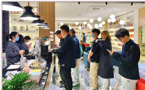
高校校园书店读者参与“你选书 我 买单”活动

高校与地州市州高校协同推进的建设格局。同 时,通过线上线下相结合的方式,在各高校开 展党史学习教育文化交流、阅读分享活动,持 续发挥文化服务平台和宣传阵地作用,进一步 提升湖北在校大学生学习党史的热情,坚定中 国特色社会主义道路自信、理论自信、制度自 信、文化自信。