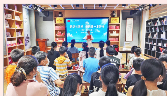
仙 桃 书 城 开 展 2021 年 “ 新 华 书 店 杯 ” 暑 假 读 一 本 好 书 活 动