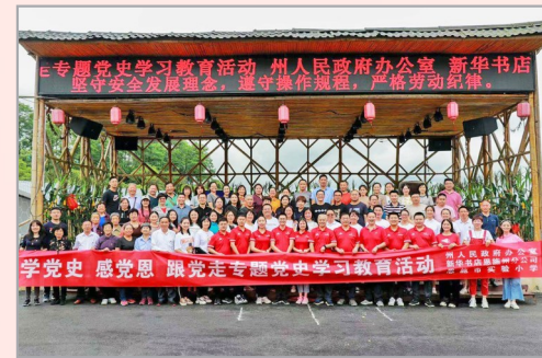
恩施州人 民政府办公室、 湖北新华恩施 州分公司、恩施 市实验小学联 合开展“重温革 命史 奋进新征 程”专题党史 教育

在今天的党史学习教育中,湖北新 华针对少儿特殊群体,全省门店定期结 合“慧悦读+创手工”开展红色故事会, 邀请儿童及家长共同参与亲子活动,同 读经典红色故事,传承优良红色家风, 让读者在朗读红色经典和具有鲜明时 代感的作品中接受红色教育,增进对党 的热爱;高效组织全省新华书店员工开 展“走出去”服务党史学习教育,通过举 办流动书展、专家讲座等“十进一创”文 化活动,提升活动参与度。采取店内店 外、线上线下相结合的方式,将红色经 典阅读活动与全民阅读相结合,开展群 众参与度高、互动性强、形式多样、丰 富多彩的红色经典系列文化活动,将活 动范围覆盖到城市、高校、军营、乡 村(社区)、中小学校等各个领域,让 红色书香溢满整个荆楚大地,不断满 足湖北省干部群众高品质阅读需求。