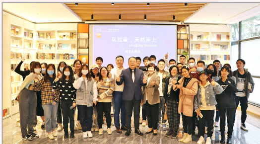
倍阅·中南财经政法大学南湖店“书香茶 山刘 博文中南大”主题文化活动

2021年,湖北省新华书店集团全面拓展文 化产业周边领域,打造深度服务高校师生、延 伸教学服务体系,打通学校之间、学科之间、地 域之间、校企之间的壁垒,服务高校全民阅读、 思政教育和通识教育体系建设,实现教育资源 共享、学科资源互补、学生交流互动、校企合作 互信,把高校实体书店打造成高校师生党史学 习教育基地、创新创业实践基地,初步构建成为 “图书+”“文化+”的综合性文化服务平台,并 逐步形成部属院校、省属院校、市属院校、民办 院校模块化建设,研究型本科高校、教学型本 科院校和技能型职业院校类型化普及,武汉市