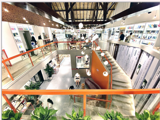
倍阅·华中农业大学店