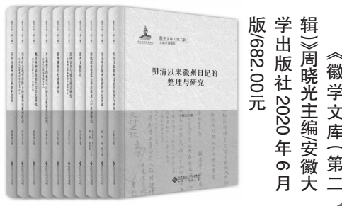
《徽学文库(第二辑)》周晓光主编安徽大学出版社2020年6月出版682.00元

其三,《文库》与徽学学术研究工作相辅相成,对推动中华优秀传统文化创造性转化和创新性发展具有极其重要的意义。《文库》涉及传统徽州社会的诸多层面,全方位、深层次地折射出传统徽州文化的深刻内涵。作为中华优秀传统文化研究的重要组成部分,《文库》有利于充分发掘、大力保护徽州地方特色文化,服务安徽文化建设,在弘扬中华优秀传统文化的当下具有极其重要的现实意义。