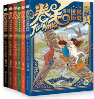
“卷毛漫游世界历史”系列