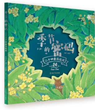
《季节的密码·二十四番花信风》