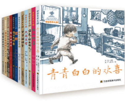
“中国艺术之旅”系列