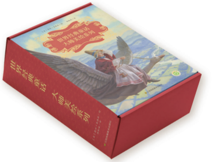
“世界经典童话大师彩绘”系列