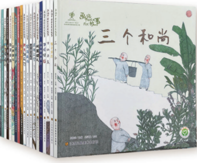
“画说中国经典民间故事”系列