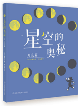
《星空的奥秘·月亮篇》