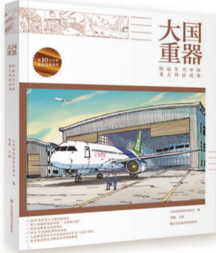
《大国重器·图说当代中国重大科技成果》