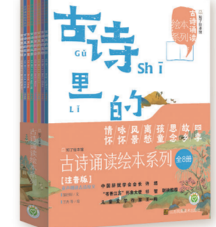
“古诗诵读绘本”系列