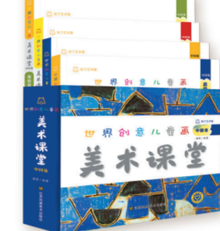
“世界创意儿童画美术课堂”系列