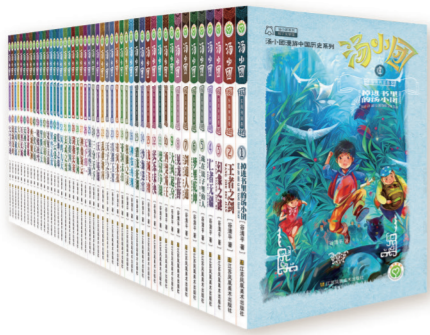
“汤小团漫游中国历史”系列