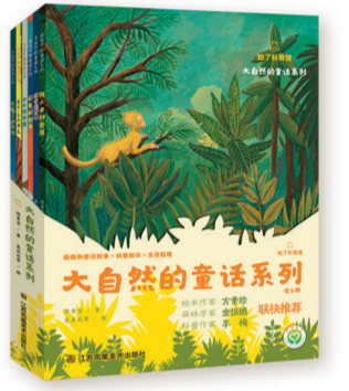
“大自然的童话”系列