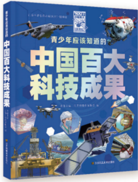
《青少年应该知道的中国百大科技成果》