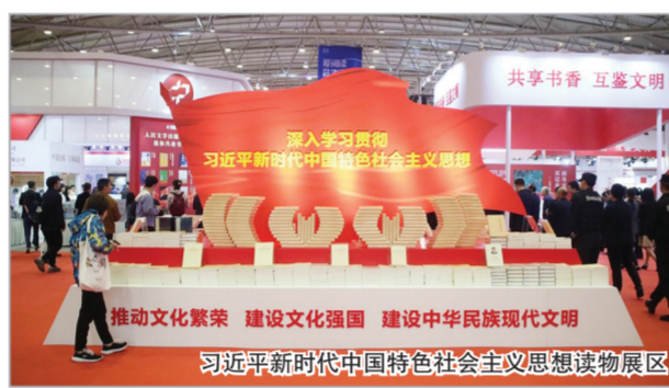
习近平新时代中国特色社会主义思想展区