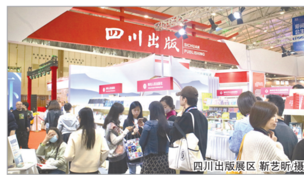
四川出版展区

苏文化出版工程(31种、800余册)、中华优秀传统文化、巴蜀优秀传统文化、冷门绝学、第三极、书香童年等重大出版工程成果,《走近三星堆》等三星堆主题图书,《熊猫花花》《熊猫萌兰》等大熊猫主题图书,《我用一生爱中国》《行走的光芒》等时代精神主题图书等川版精品图书6000余种。