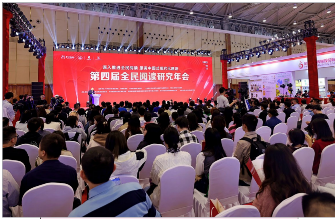
第四届全民阅读研究年会现场