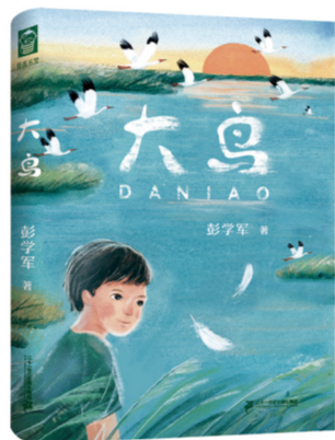
作者：彭学军 出版时间：2023年11月 出版社：二十一世纪出版集团