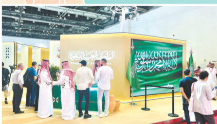
主宾国沙特阿拉伯王国展区