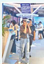
读者体验数字产品