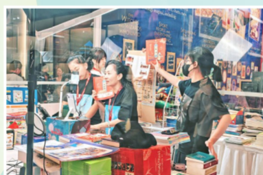
主播王芳在展会现场直播售书