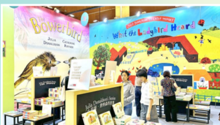
进口原版图书销售区