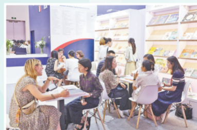
版贸洽谈热烈进行