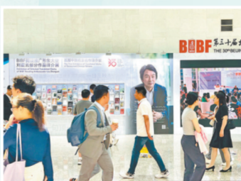
读者观看刘震云部分作品译介展、首届中国名家名作译介展