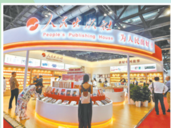
人民出版社展位吸引读者驻足