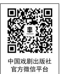
中国戏剧出版社 官方微信平台