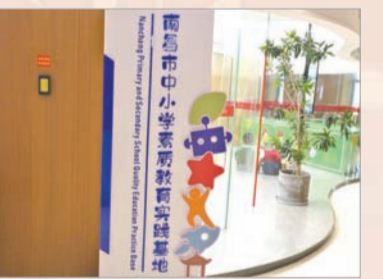
南昌市中小学素质教育实践基地

建设好实体书店,为广大读者提供高质量的阅读和学习场所,也是江西新华履行国有文化企业职责、服务教育的重要举措。江西新华近年来先后投入数亿元,持续加大江西省新华书店的建设改造力度,积极推进文化综合体建设,现有门店升级以及便民服务网点建设,推进向“有温度的体验、社交和学习中心”转型。