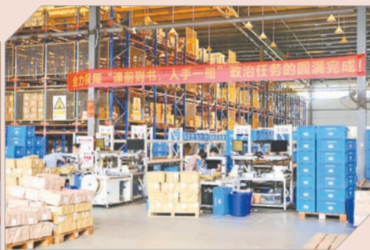
全力确保“课前到书,人手一册”