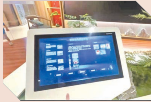
“江西新华在线”体验馆