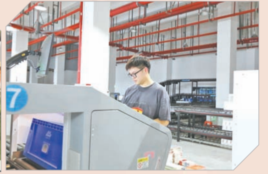
现代出版物流中心

随着新一轮科技革命和产业革命深入发展,教育数字化转型已成为共识。江西新华将数字化转型作为推动高质量发展的重要战略,投资约2000万元打造了数字化赋能平台——“江西新华在线”,该平台由江西新华自主研发,旨在构建一个全方位、生态化的线上新华书店,实现教育服务赋能、全民阅读推广、政治读物发行、文化数字惠民、新业态孵化等五大功能。截至目前,平台用户数达100万,累计交易额3.6亿元。