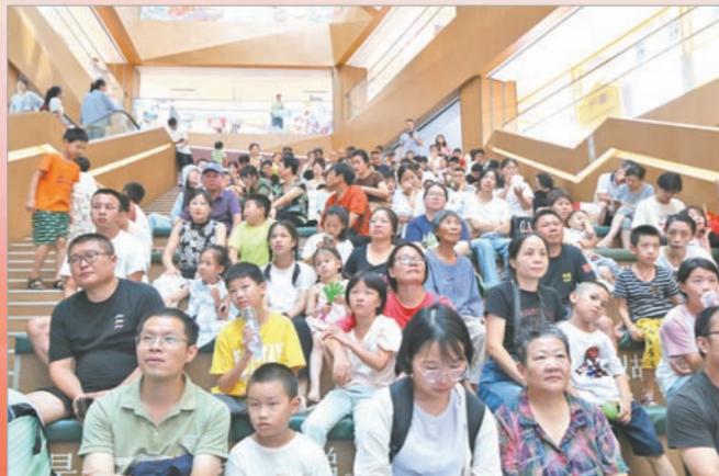
南昌书城阅读活动