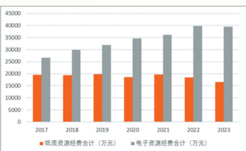
2017~2023年江苏本科院校纸质资源与电子资源经费对比柱状图

纸质资源占统治地位的文献资源建设策略已经逐步转变为电子资源为主、纸质资源为辅的文献资源建设新格局。