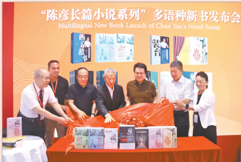
2025年6月19日,中国出版协会理事长郭书林,中国版权协会理事长阎晓宏,中国图书评论学会会长郭义强等出席“陈彦长篇小说系列”多语种新书发布会并为新书揭幕。

四十年风雨兼程,四十载书香绵延。2025年,陕西师范大学出版总社(以下简称总社)迎来建社四十周年。四十年在历史长河中虽只一瞬,但对与改革开放同舟、与教育事业同行的陕西师大出版人来说,却是一段充满奋斗与拼搏、满载成长与收获的峥嵘历程。从1985年那个春天启程,总社一路砥砺前行,创新前行,现已成为集图书、期刊、电子音像、数字出版及教育文化服务于一体的现代综合出版传媒机构。年出版图书3800余种,其中新书1500种,出版期刊312期,年产值超16亿元,社会影响力与日俱增,服务社会能力持续跃升,走出了一条独具特色的大学出版之路,为传承文化、服务教育做出了积极贡献。