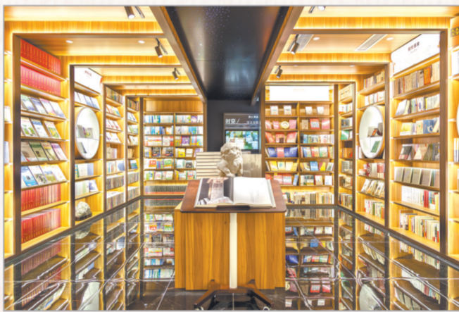
总社社史与精品陈列室

索——席泽宗院士自选集》《唐代美术史》等900余种学术著作、社科读物和教材获国家图书奖、中国图书奖等国家或省部级大奖。“十二五”以来,总社着力推进优质项目策划开发,持续打造出版精品,连续六届荣获中华优秀出版物奖;《先前的风气》荣获第六届鲁迅文学奖,被评为“2014中国好书”;《金陵十三钗》等多种图书入选“大众喜爱的50种图书”;《唐诗百话》《汉字为什么这么美》等先后入选向全国老年人推荐优秀出版物、向全国推荐中华优秀传统文化普及图书等;《市井西仓》《文心雕龙:集校版》等荣获“最美的书”;《历史作为镜像——习近平文艺讲话与新时代中国文艺复兴》《塬上》等多种图书获陕西省“五个一工程”奖、陕西图书奖等;《神话叙事与社会发展研究》《唐长安城考古笔记》等入选国家社科基金中华学术外译项目;《诗说中国》《中国民间泥彩塑集成》等近60个项目入选国家重点图书出版规划、国家规划教材;《神话学文库》《敦煌西夏石窟研究》等30余个项目获国家出版基金、国家文化产业专项资金、国家古籍整理出版专项经费资助;《儒学文汇》《秦简简史》等近百