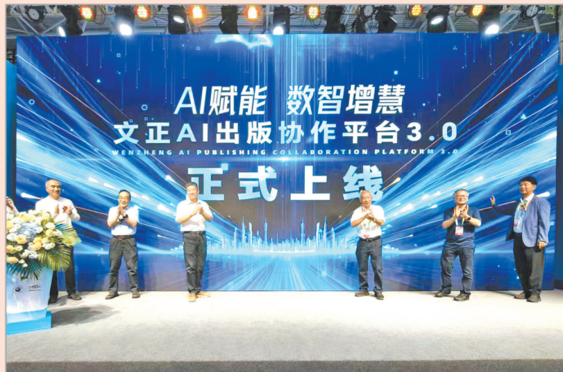
2025年7月25日,在第33届全国书博会上,总社联合开发的“首阳文正AI出版协作平台3.0”正式上线。

四十年以大局为重,体现使命担当。 总社自觉纳入国家和社会大局,坚持党对出版工作的全面领导,坚持正确政治方向、出版导向和价值取向,筑牢出版质量生命线,始终把服务国家和社会发展大局作为首要任务,把主题出版作为精品出版的重要抓手,重点围绕“弘扬中华优秀传统文化”“赓续红色文化”“乡村振兴、脱贫攻坚”等方向,做好主题出版。“延安文艺与20世纪中国文学研究”“乡村振兴原创文学书系”“红色延安口述·历史”等一大批突出学理化、体系化、大众化、精品化的主题出版物持续推出,《中亚往事》《美丽中国建设之路》《共产党人的精神家园——重读延安故事》等多个项目入选中宣部、教育部主题出版重点出版物、国家重点图书出版规划,《中学历史教学参考》“党史学习教育”专题受到中宣部出版局肯定,荣获国家哲学社会科学文献中心2024年度教育学最受欢迎期刊。从2018年起,总社连续7年获评全国出版单位社会效益评价考核优秀,充分体现了总社的大局观和使命。