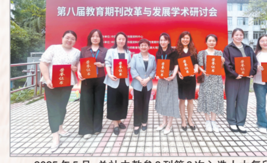
“中学教学参考”系列期刊