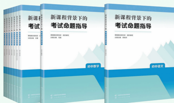
《新课程背景下的考试命题指导》

丛书涵盖初中语文、初中数学等9个学科,主要分析考试改革趋势和依标命题的具体要求,阐释如何做好命题规划,探讨不同类型试题的命题方法,供一线教师、教研员在命题过程中参考借鉴,提升命题质量。