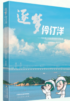
《逐梦伶仃洋——写给青少年的港珠澳大桥故事》

全书围绕港珠澳大桥这一国家工程、国之重器,内容翔实,语言通俗,兼具科学性与趣味性。正文叙述之外,精心编排了“人物故事”“建造故事”“超级装备”三个栏目,为青少年展现了科学之“智”与奋斗之“魂”。