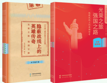
《隐蔽战线上的英雄传奇——光荣之旅 强国之路》

本书入选“主题出版重点出版物”,讲述了我党历史上72位隐蔽战线英雄的故事。分为小学低年级、小学中高年级、中学3册,由一线教师参与编写,是弘扬红色革命文化、推动国家安全教育进校园的有益实践。