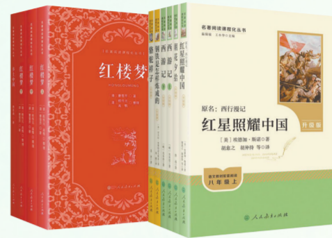
“名著阅读课程化丛书”(升级版)

丛书围绕学生语文核心素养的发展,严格按照教材进行设计,精选权威底本,针对中学生的阅读特点和阅读难点,邀请一线名师科学设计阅读规划、阅读策略指导等栏目,配备精当的批注讲解,精心绘制随文插图,最终实现“读整本书”的目标。