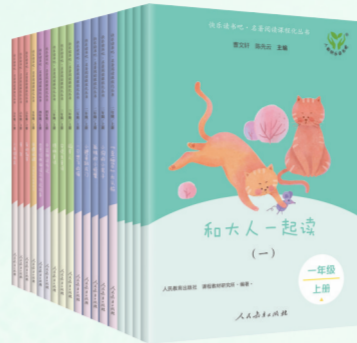
“快乐读书吧丛书”(新版)

丛书与语文课堂教学同步,遵循阅读规律,兼顾学生阅读能力的差异性。丛书力求全面实现课外阅读课程化,指导学生科学合理地学会阅读,提高自主阅读、独立阅读能力,养成良好的阅读习惯。