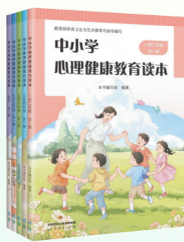
《中小学心理健康教育读本》

读本共5册,采用“主题+专题”的“课程超市”编排方式,内容以学习心理健康知识、参加心理健康活动、掌握心理健康方法为主线,充分融入了中华优秀传统文化中有关心理健康的哲理和智慧,有针对性地回应中国学生的常见心理问题,提升学生的整体心理素质和心理水平。