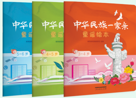
《中华民族一家亲童谣绘本》

丛书由学前教育名家冯晓霞主编,编排为3—4岁、4—5岁、5—6岁三册。每册均有18首童谣,配以精美的画面。书中还为每首童谣编写了“小提示”,通过听童谣、说童谣、学童谣,将中华民族共同体意识植入幼儿的心灵。