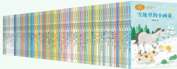
“课文作家作品”系列

系列图书收录了课文作家创作的其他作品。编者根据不同阶段学生的阅读能力和阅读要求,精心选择难度适中的文章。每本书后还编排了“作家和你面对面”的内容,让学生了解作家的经历和创作,学习读写方法,也能为教师教学提供背景资料。