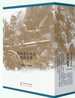
《写给青少年的抗战故事》

全套书共分20册,主要包括抗日战争史的总体叙述以及九一八事变、七七事变、港澳台抗战、抗战中的海外华侨与国际友人等19个重要主题,旨在引导青少年深切感受伟大抗战精神,进一步强化家国情怀和国防意识。